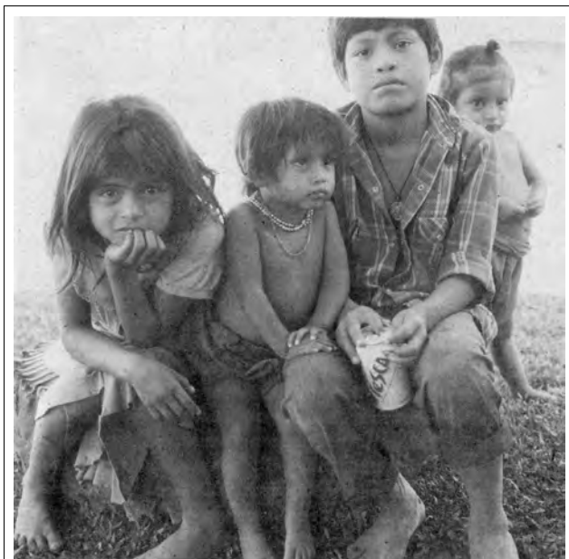
Infanoj el zapatista komunumo

marki, ke tiu agado –kiel ĉiuj komunumaj– ricevas neniun ekonomian repaĝon.