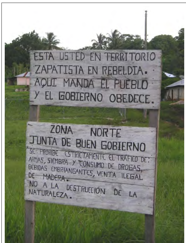
Vi estas en ribelema zapatista teritorio. Tie ĉi ordonas la popolo kaj la registaro obeas.

Pri la temo de la instruado ni ege surprizis, kiam ni vizitis lernejojn, kie la geinfanoj partoprenas sian propran instruadon, atentas kaj lernas el sia propra historio. Ili rakontis al ni, ke antaŭe la instruado estis trudata, fremda al iliaj bezonoj kaj per unusola lingvo. Nun la instruinstigantoj estas junuloj de la sama komunumo kaj la instrumodelo surbaziĝas sur tio, kio ili bezonas, kaj sur ilia realo ageme kaj dulingve. Gravus ri-