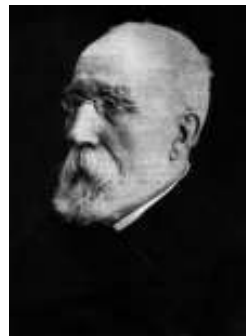
Francesc Pi i Margall

Dum la milito ili suferis pro malfacilaĵoj por garantii la viktualion, pro la pliigo de la mendado kaj pro la klopodoj kolektivigi ilin. Malgraŭ ĉio ili iĝis nemalhavebla ilo ĉe la ariergardo, en multaj vilaĝoj kaj urboj okazis la unuiĝo de kooperativoj kaj ankaŭ la diversaj kooperativfederacioj unuiĝis je sola Konfederacio.