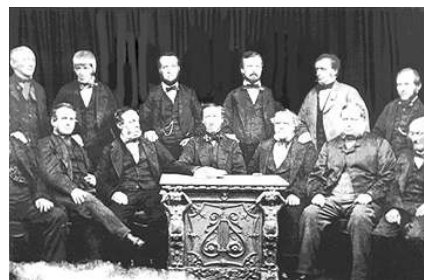
Pioniroj de la Kooperativo de Rochdale

voj kontribuas la 7%-n de la Malneta Ena Produkto. Ĉe Katalunio estas rimarkinda la ekzisto de lernejo pri kooperativismo ( www.aposta.coop ), kiu organizas periodajn kursojn kaj seminariojn.