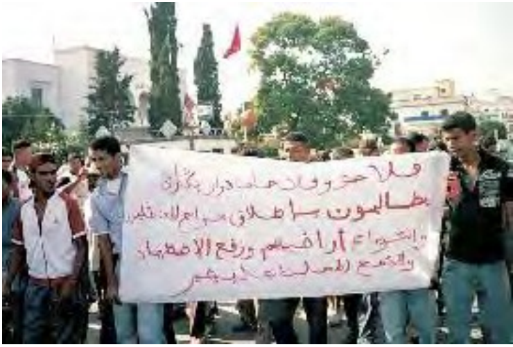
Kamparana batalo pro la tero, Ksar, Maroko