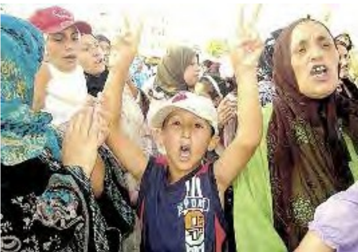
Manifestacio maldungitoj de Khourigba, Maroko