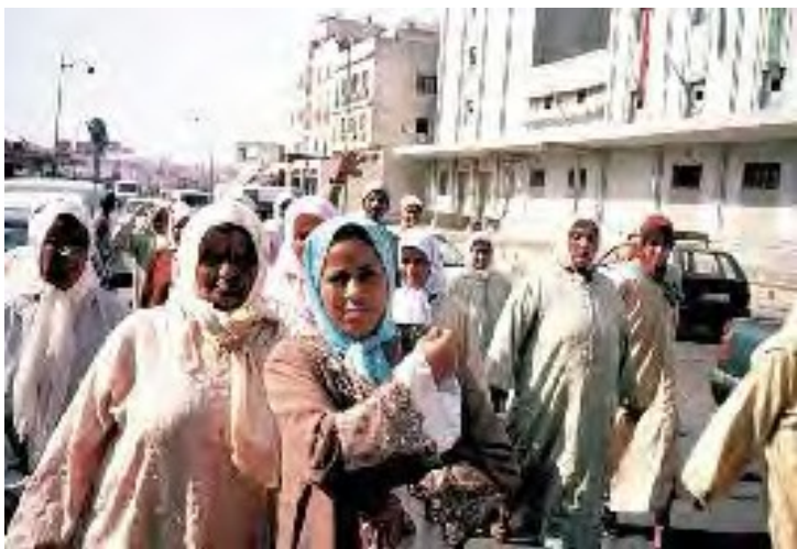
Kontraŭ la nutraĵa plikostigo, Sefrú, Maroko