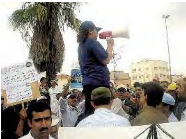
Manifestacio maldunditoj de Khourigba, Maroko