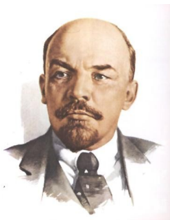
Vladimir Iljiĉ Lenin

de la revolucio kaj la sekvan bezonon modifi siajn taktikojn. Ne estis unuvoĉecon ĉe la partio sur la demandoj pri karaktero kaj orientiĝo de la tiamaĵ okazintaĵoj, eĉ ne en oktobro. Ankoraŭ plu, la Oktobra Revolucio kaj la okazaĵoj, kiuj sekvis ĝin, disvolviĝis dum la Centra Komitato de la Partio estis dividita en du tendencoj. Dume parto de la Centrala Komitato kun Lenin ĉekape antaŭdivis la neevitindan Socian Revolucion kaj proponis la pretigadon por la povopreno, la alia tendenco ĉefita de Zinoviev kaj Kamenev denoncis la Socian Revolucion kiel aventureman kaj limiĝis alvoki Konstitucian Asembleon, en kiu la Bolŝevistoj okupus la pli maldekstrajn postenojn. La Lenina vidpunkto venkis kaj la Partio komencis mobilizi siajn fortojn por la eblo de findecida amasa lukto kontraŭ la provizora registaro.